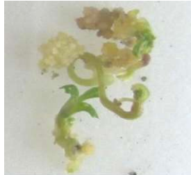
Cals de carotte