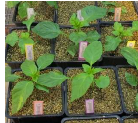
Plants de piment acclimatés