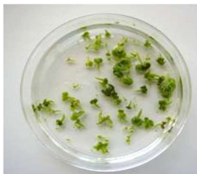
Embryons de colza